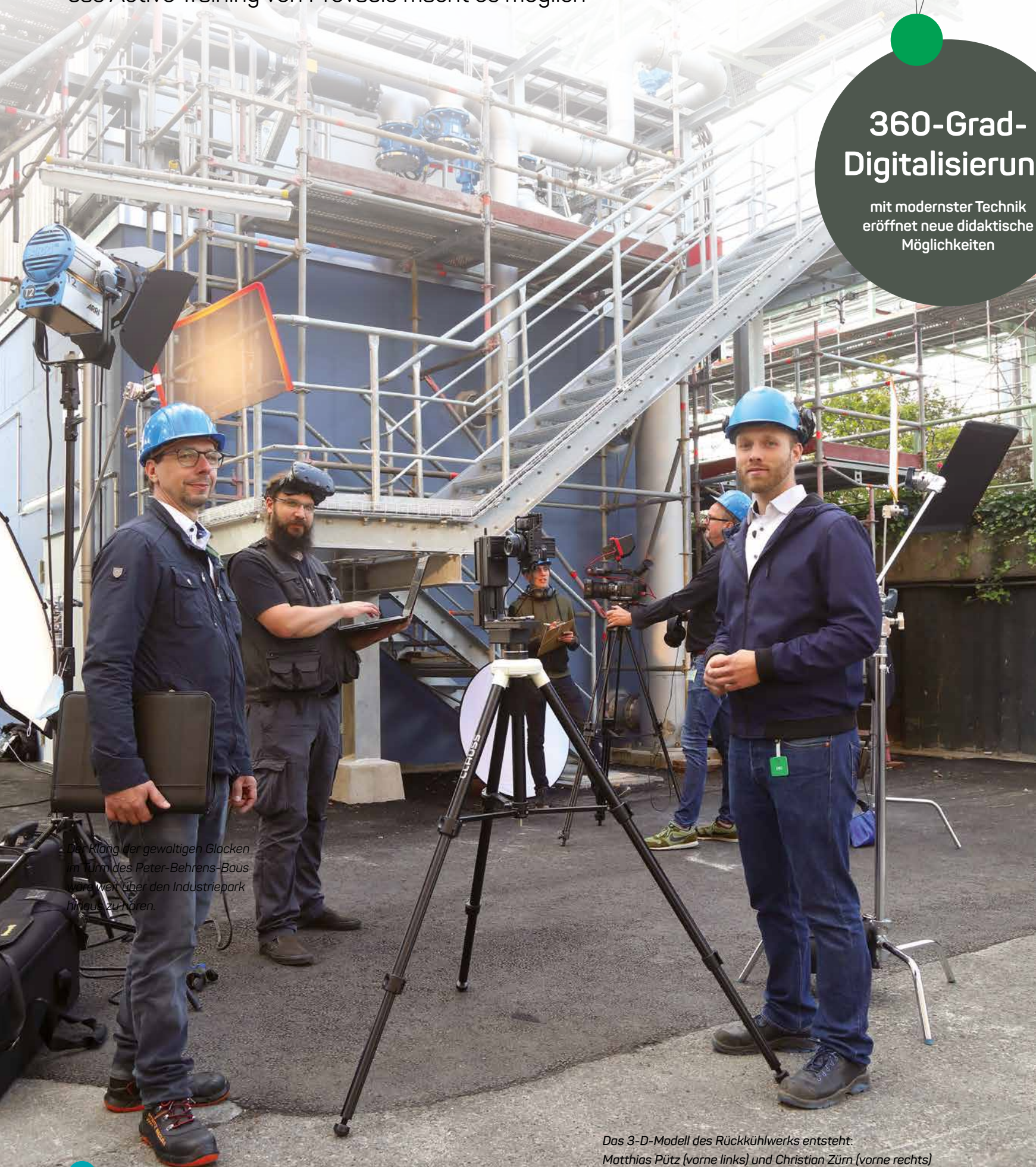
Der Klang der gewaltigen Glocken im Turm des Peter-Behrens-Baus ist weit über den Industriepark hinaus zu hören.

Expertenwissen jederzeit verfügbar – das Active Training von Provalids macht es möglich